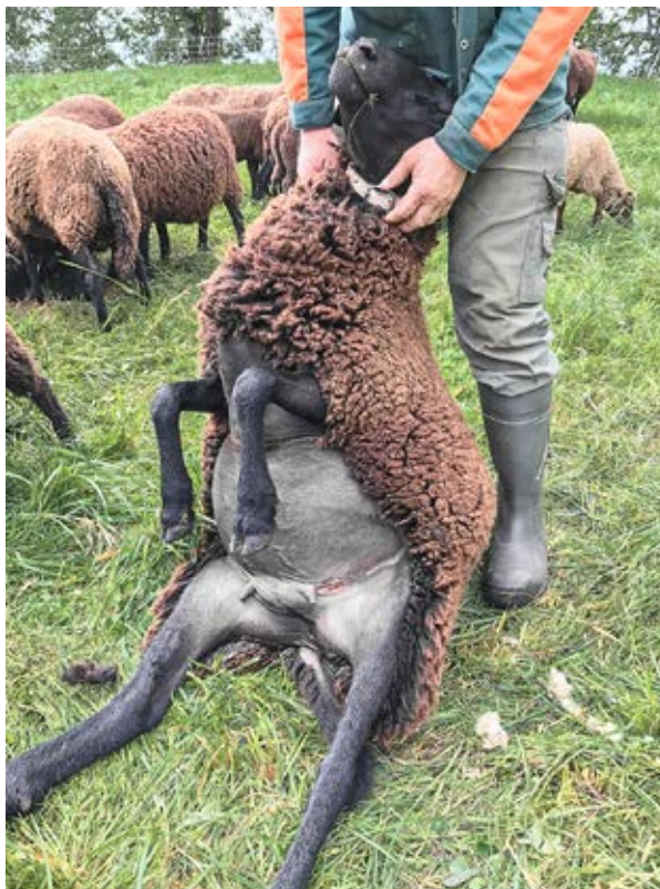
Beprobung eines hockenden Schafes. Prélèvement d'un échantillon sur un mouton retourné.

Die Moderhinke ist in der Schweiz für erhebliche wirtschaftliche Verluste und vermindertes Wohlergehen bei Schafen verantwortlich, deshalb ist seit einigen Jahren ein nationales Bekämpfungsprogramm unter der Leitung des Bundesamtes für Lebensmittelsicherheit und Veterinär-