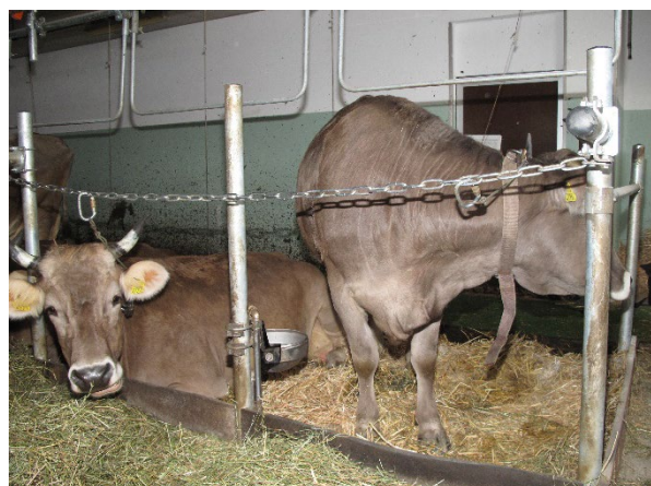
Fig. 1 : dispositif d'attache avec une chaîne et sans barres dans l'espace réservé à la tête.

peut partir du principe que la chaîne doit avoir une longueur minimale d'environ 60 cm. La longueur de la chaîne doit toutefois être adaptée à la masse corporelle de l'animal et contrôlée régulièrement. La crèche plate et ouverte donne aux animaux plus de liberté de mouvement pour la tête, mais facilite la dispersion vers l'avant du fourrage qui devient ainsi plus difficilement accessible. Pour atteindre ce fourrage malgré tout, les vaches s'appuient avec la nuque sur la chaîne qui porte l'attache par le haut, ce qui peut provoquer des lésions cutanées au point de pression. Il faut donc repousser régulièrement le fourrage vers les vaches. En outre, un gainage de la chaîne porteuse avec un tuyau permet de réduire les lésions de la peau.