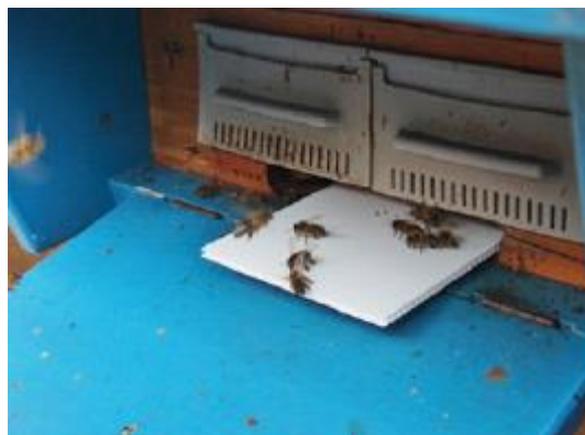
Schäfer-Diagnosefalle in Magazin Schweizer Kasten (links) und Bienenhaus (rechts)