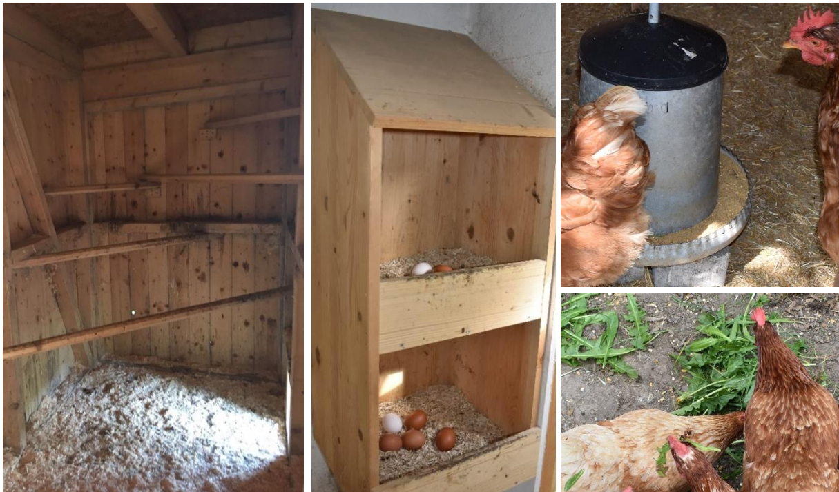
Abbildung 3: Im ersten Bild sind 5 Sitzstangen in unterschiedlichen Höhen zu sehen. Das mittlere Bild zeigt zwei auf drei Seiten und oben geschlossene Nester mit Einstreu. Rechts oben ist ein runder Futtertroch sichtbar. Löwenzahn und Körner werden als Ergänzung angeboten.