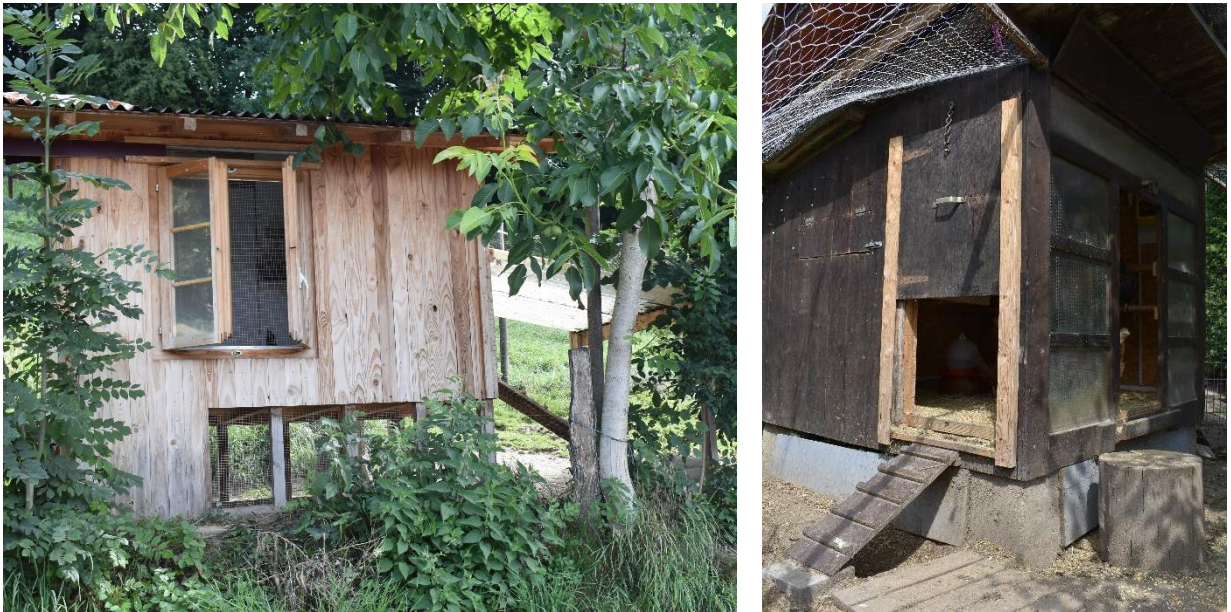
Abbildung 2: Zwei Beispiele von Ställen mit grossen Öffnungen, die Licht und Frischluft hereinlassen. Das linke Vordach des Stalls lässt sich an den Seiten mit Drahtgeflecht abschliessen, wodurch ein Wintergarten entsteht. Die Auslaufläche des Stalls auf der rechten Seite ist mit einem Netz abgegrenzt.

Die optimale Besatzdichte hängt u. a. von der Grösse und Stabilität der sozialen Gruppe ab. Bei kleinen Gruppen von 2 bis 15 Tieren wird eine Dichte von höchstens 4 Hühnern pro m 2 empfohlen.